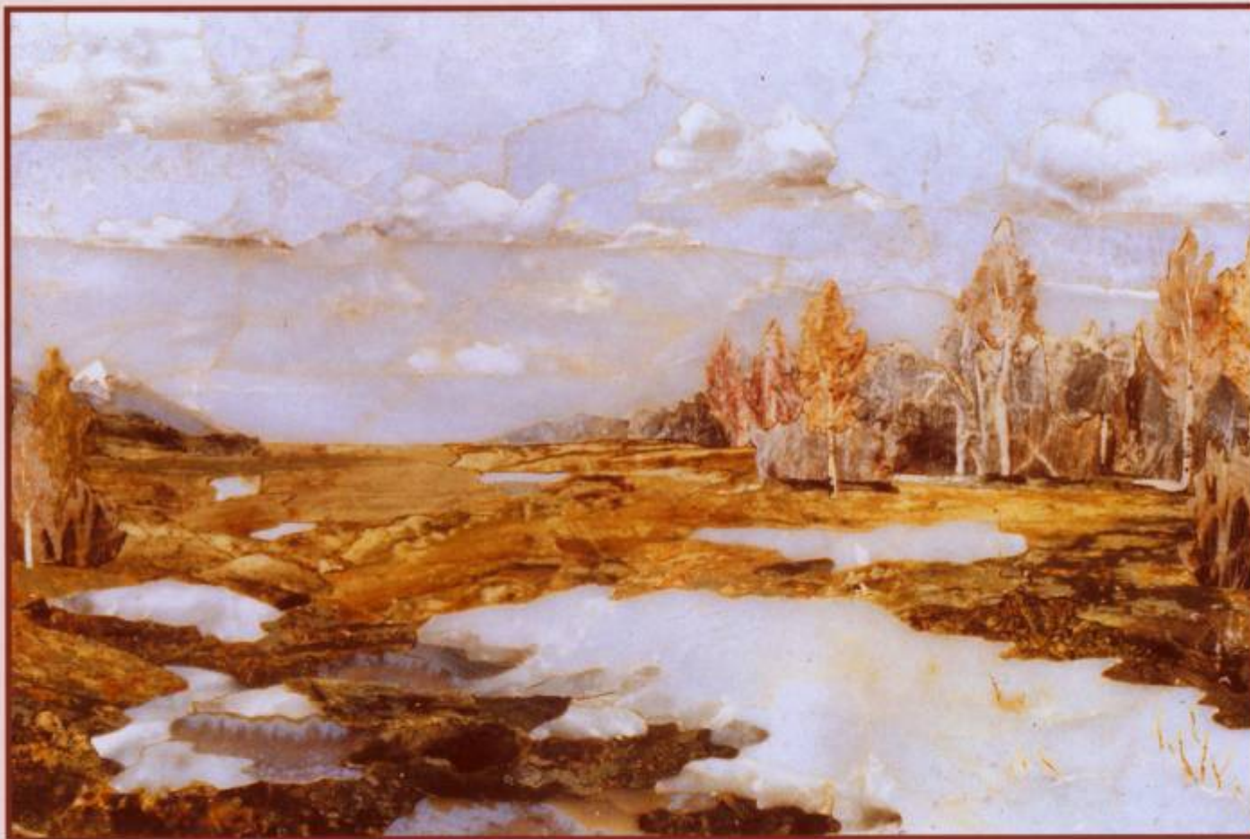
“Последний снег”, 1990 г. (сапфирин, брусит, яшмоиды, кальцифир) 14x21 см, США