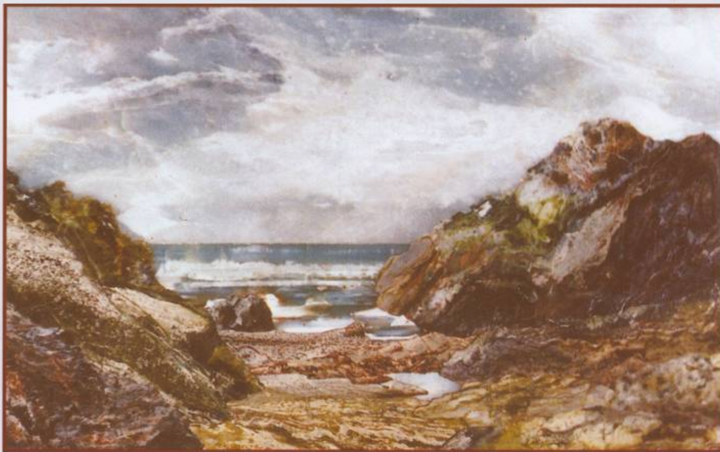
“Скалистый берег”, 1999 г. (брусит, оникс, кальцифир) 38x26 см, СВКНИИ