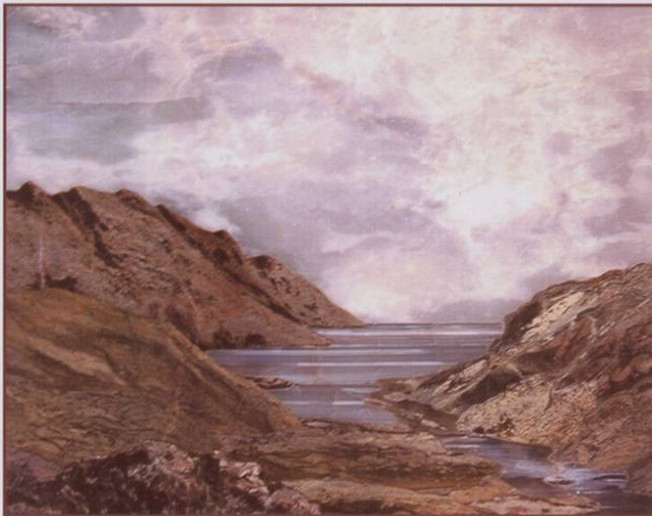
“Устье ручья”, 1995 г. (брусит, оникс, кальцифир) 19,8x23 см