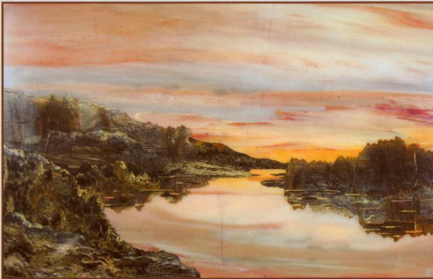
“Тихий вечер”, 1991 г. (газганский мрамор, кальцифир, офиокальцит) 19,5x28,5 см Магаданский областной краеведческий музей