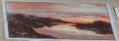
Пейзаж, 1880 г.