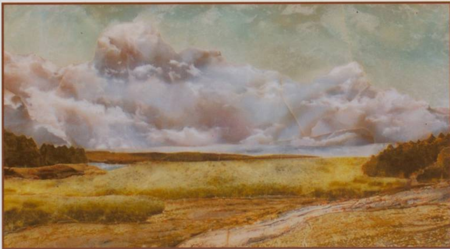
“Русское поле”, 2002 г. (брусит, офиокальцит) 22х29 см