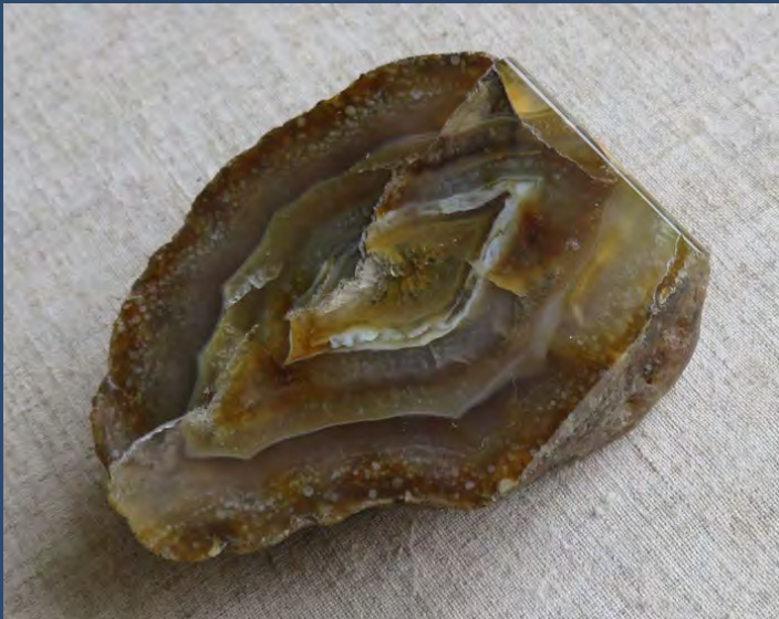
ХАЛЦЕДОНОВАЯ ГАЛЬКА со слоистым строением

Халцедоны в агатах — разнообразны по цвету: сардер (сард) — бурый, коричневый; сердолик — медово-желтый, оранжево-желтый; карнеол — красный; хризопраз — яблочно-зеленый; плазма — зеленый; гелиотроп — зеленый с красными пятнышками; сапфирин — синевато-черный, кахолонг — молочно-белый.